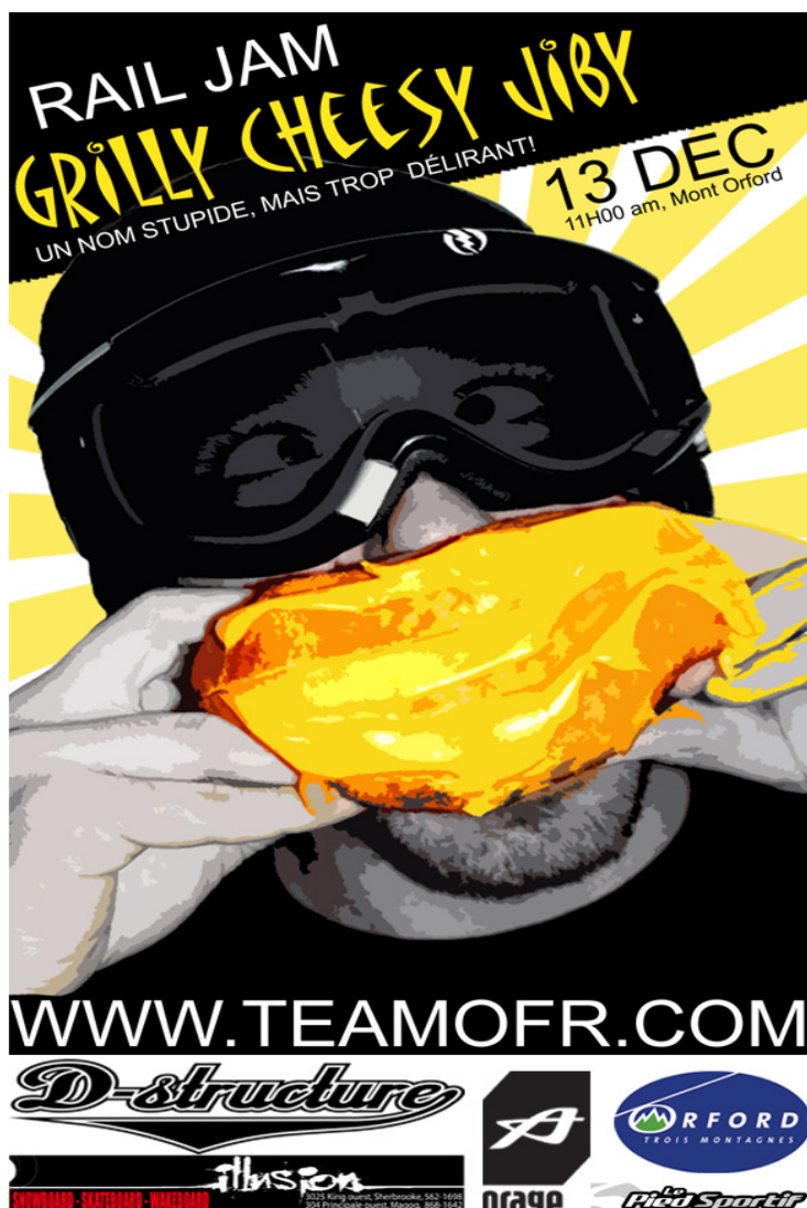
Affiche ayant servi à faire la promotion de l'événement.

Cette année aura lieu la cinquième édition de notre événement Rail Jam . Une compétition de rails qui attire les foules chaque année et qui consiste à installer des modules de style libre le premier jour de la saison hivernale. Quelques modules de rampes sont installés au pied des pentes. Chaque année nous accueillons une centaine d'athlètes et nous organisons une grande fête de début de saison avec de la musique et un festin BBQ. Un événement qui fait beaucoup parler par son originalité et la qualité de son organisation, du plaisir assuré!